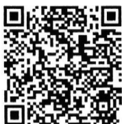
QR Code เอกสารประกอบการประชุม

หมายเหตุ กำหนดการอาจมีการเปลี่ยนแปลงได้ตามความเหมาะสม