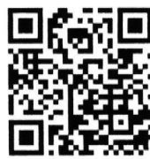
QR Code แบบประเมินความพึงพอใจ