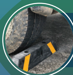
ยางห้ามล้อรถ จากขยะอุตสาหกรรม มหาวิทยาลัยทักษิณ