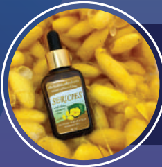
ผลิตภัณฑ์จากโปรตีนไหม คณะเทคนิคการแพทย์ มหาวิทยาลัยสงขลานครินทร์