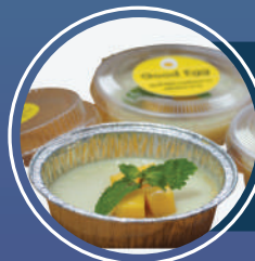
พุดdingไข่ขาวเสริมโยอาอาหาร คณะอุตสาหกรรมเกษตร มหาวิทยาลัยสงขลานครินทร์