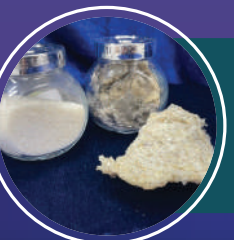
กรรมวิธีการผลิตโปรตีนไฮโดรไลส จากเศษเหลือทิ้งที่มีมูลค่าต่ำ คณะอุตสาหกรรมเกษตร มหาวิทยาลัยสงขลานครินทร์