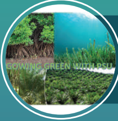
GOWING GREEN WITH PSU มหาวิทยาลัยสงขลานครินทร์

งานวิจัยและนวัตกรรม จากสถาบันการศึกษา และเครือข่ายอุทยานวิทยาศาสตร์กว่า 200 ผลงาน ตัวอย่างงานวิจัยและนวัตกรรม อาทิเช่น