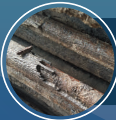
ระบบประเมินความหนาที่แลกเปลี่ยน ความร้อนของโรงไฟฟ้าที่เกิด การกีดร้อนจากไอกรดซัลฟิวริก มหาวิทยาลัยนราธิวาสราชนครินทร์