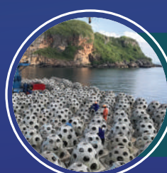
โดมทะเล คณะวิศวกรรมศาสตร์ มหาวิทยาลัยสงขลานครินทร์