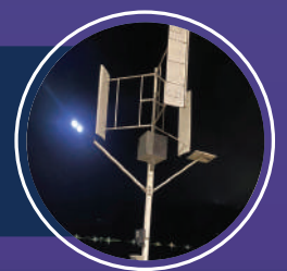
โคมไฟถนนระบบไฮบริด พลังงานลมและโซลาร์เซลล์ คณะการจัดการสิ่งแวดล้อม มหาวิทยาลัยสงขลานครินทร์