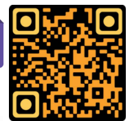
แบบฟอร์มสมัคร