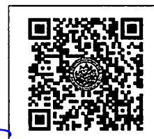
QR-Code เว็บไซต์