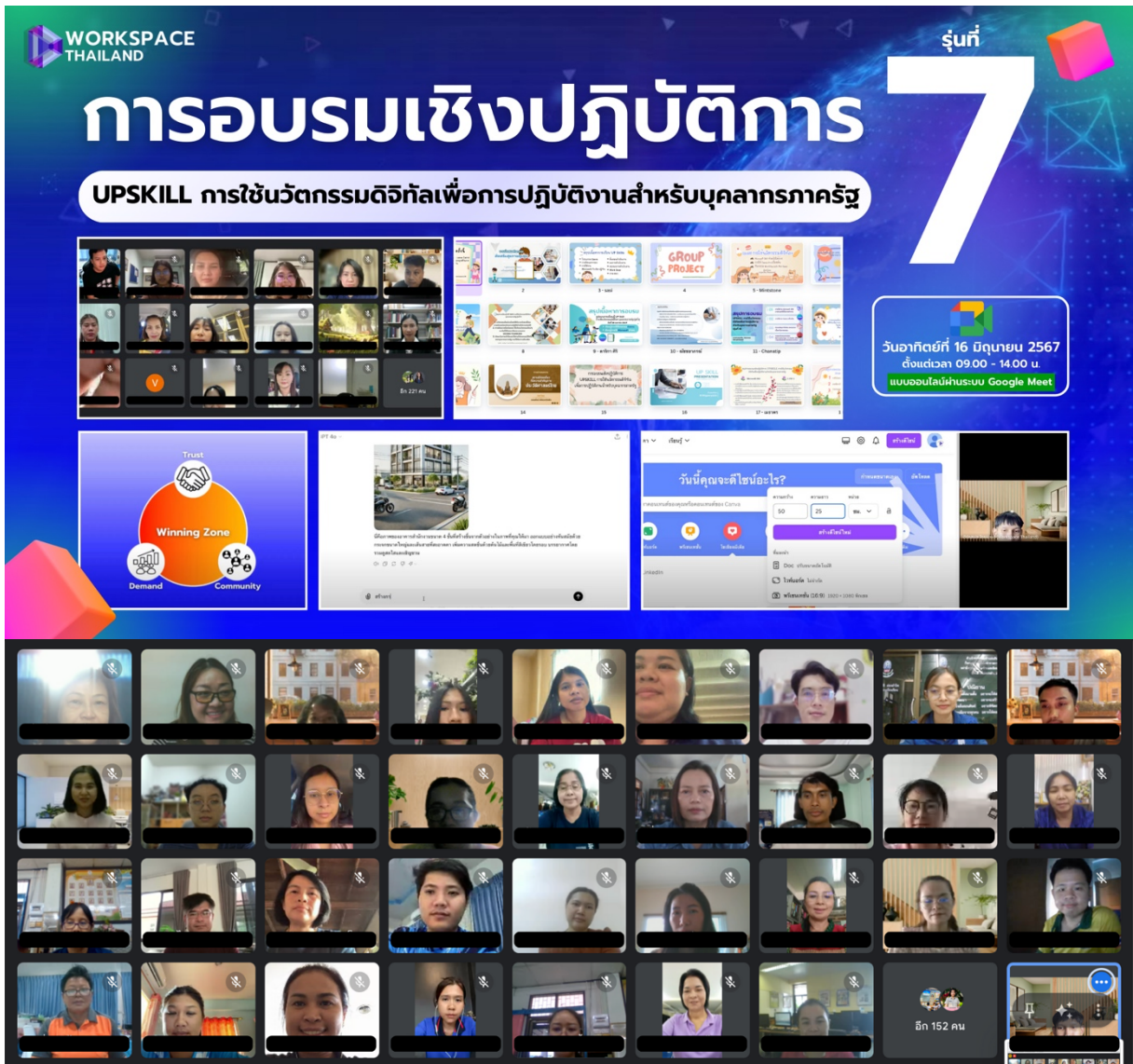
ภาพที่ 1 การอบรมที่ผ่านมาจัดโดยเวิร์คสเปซ ไทยแลนด์

ภาพถ่ายกิจกรรมที่ผ่านมาจัดโดยเวิร์คสเปซ ไทยแลนด์