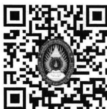
QR code สำหรับลงทะเบียน

ผู้ที่มีความประสงค์ร่วมนำเสนอผลงานวิจัยสามารถลงทะเบียนสมัครได้ที่ https://research.kpru.ac.th/std-conference๕/ หรือทาง QR code ที่อยู่ด้านล่างนี้ โดยชำระค่าลงทะเบียนหลังการส่งบทความเข้าระบบ เพื่อเป็นการยืนยันการส่งบทความให้พิจารณาเข้าร่วมการประชุมวิชาการ