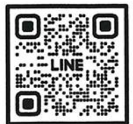
QR-Code ลงทะเบียนอบรม QR-Code เพื่อสอบถามข้อมูล