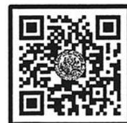
QR-Code ลงทะเบียนอบรม

สำนักงานบริการวิชาการ มหาวิทยาลัยศิลปากร (ตลิ่งชัน) โทรศัพท์ ๐-๒๑๐๕-๔๖๘๖ ต่อ ๑๐๐๒๖๖ , ๑๐๐๒๕๒